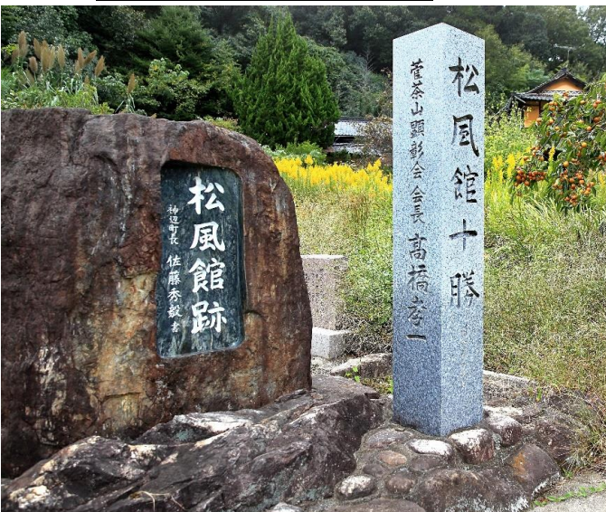
松風館十勝碑林の主碑